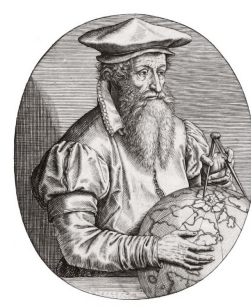
Gerard Kremer - Mercator